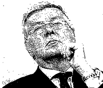
Sviluppo economico Il neo ministro Paolo Romani