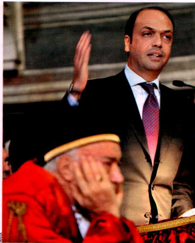
CASSE BLINDATE Tra i creditori del ministero di Angelino Alfano ci sono perfino gli avvocati, che anticipano le somme per il gratuito patrocinio. Ma provare a pignorare Via Arenula è diventato, per legge, quasi impossibile

Cinque storie, una sola morale: «Siamo tutti uguali davanti alla legge, ma lo Stato è più uguale degli altri» sospira Tommaso Palombo di Iliia, che riunisce cinquanta imprese specializzate in intercettazioni. Solo il credito degli associati a Iliia verso il ministero della Giustizia ammonta a 350 milioni. Confindustria stima quello complessivo della Pubblica amministrazione verso le imprese in 60-70 miliardi. «Ma con i debiti degli enti locali, tra beni e