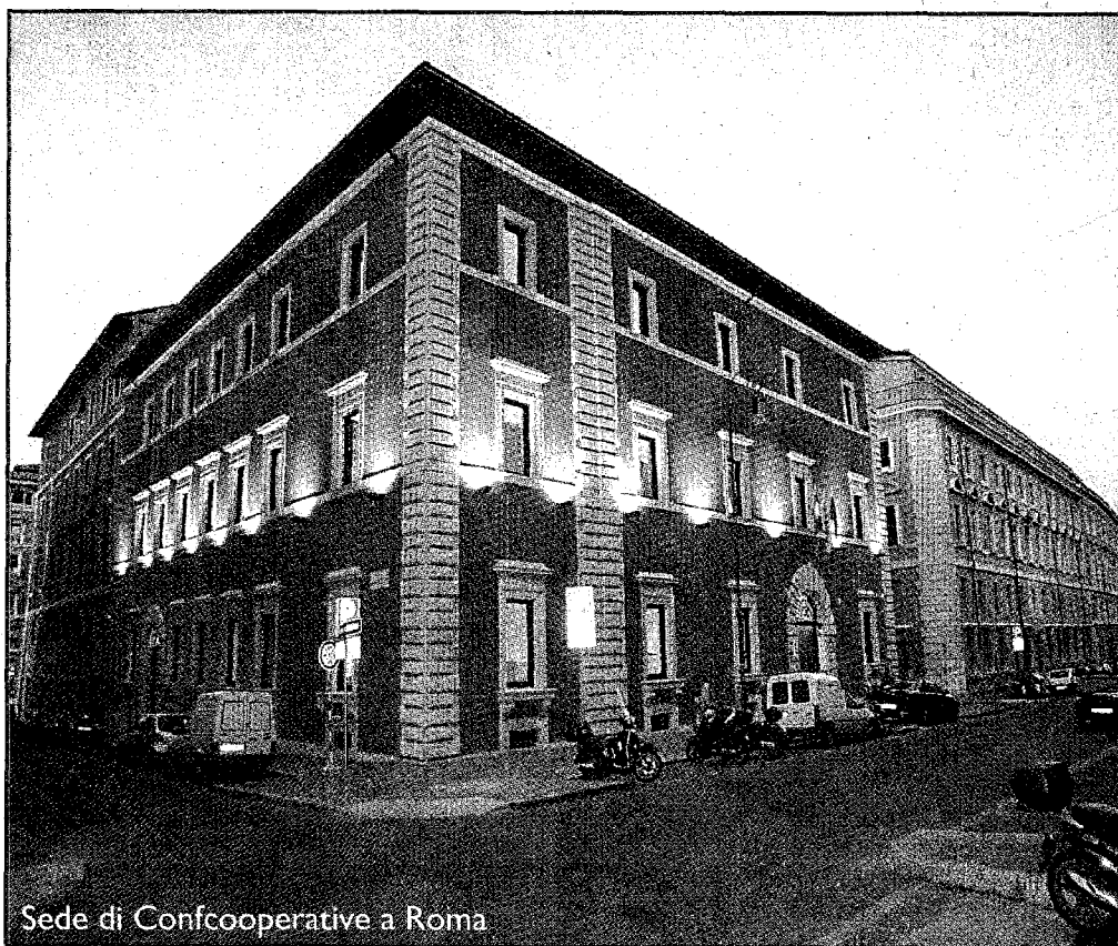
Sede di Confcooperative a Roma

L'auditorium della Conciliazione, luogo che di solito ospita i concerti romani, ha accolto il 14 luglio scorso una folla oceanica di operatori arrivati all'annuale appuntamento con la trentaseiesima assemblea di Confcooperative .